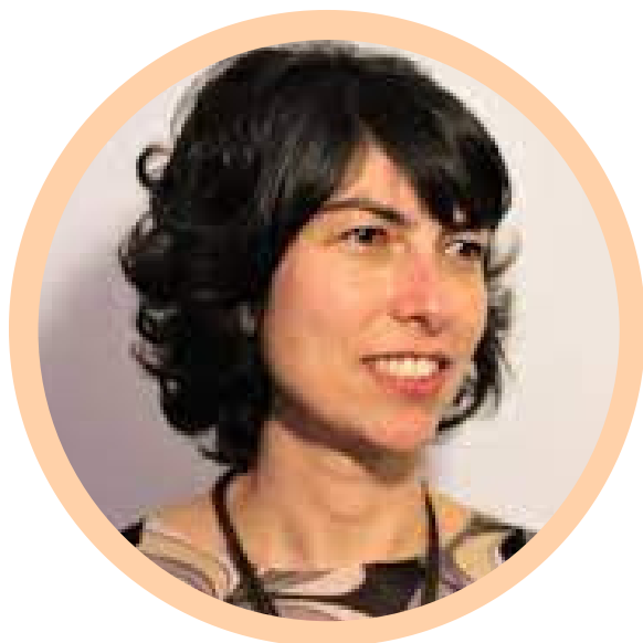
PROF. GABRIELA LOTTA

El curso tiene como objetivo presentar a los estudiantes la literatura sobre la relación entre burocracias y políticas públicas. Se presentarán los principales enfoques y modelos analíticos que observan el papel de las burocracias en la formulación e implementación de políticas públicas. El curso hará un recorrido histórico, retomando las ideas de la burocracia clásica weberiana, pasando por estudios de la relación entre burocracia y política y, más recientemente, burocracia, y la implementación y gestión de políticas públicas. Examinaremos modelos analíticos que analizan la burocracia de nivel intermedio y la burocracia a nivel de la calle. Al final, el curso permitirá a los estudiantes comprender diferentes teorías y enfoques analíticos, y les brindará un mapa conceptual sobre cómo entender la relación entre burocracia y políticas públicas desde diferentes perspectivas.