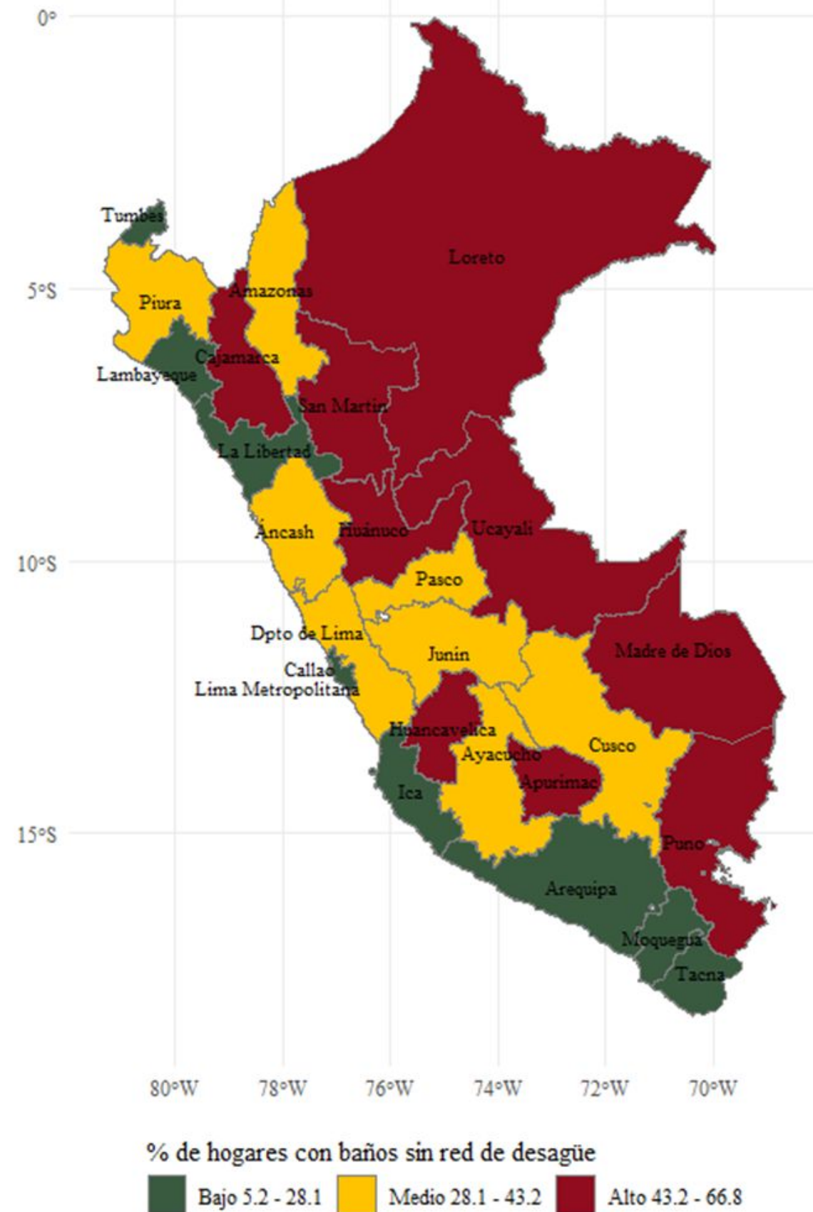
Figura 4.1: Mapa sobre el porcentaje de hogares sin un baño o servicio higiénico conectado a una red pública de desagüe según departamento de residencia en 2021