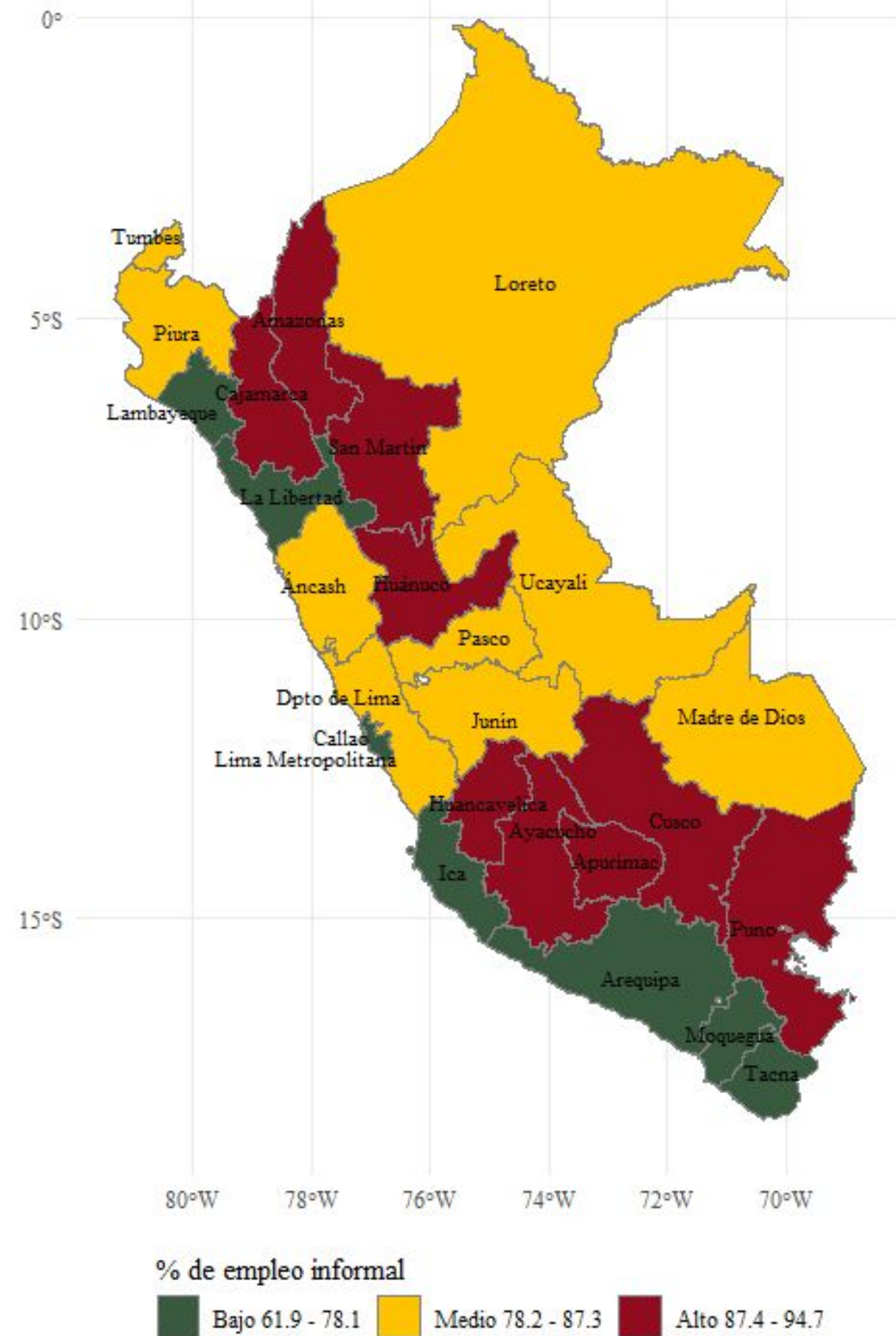
Figura 2.1: Mapa sobre el porcentaje de la PEA informal según departamento de residencia en 2021