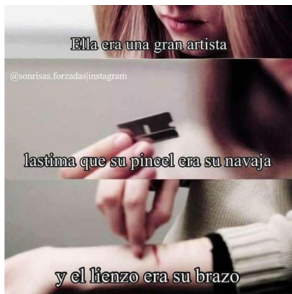
Imagen 2. Frases adolescentes #16/09 2017

En la Imagen 1 se puede evidenciar la idealización y romantización del suicidio. Se tiene una imagen extraída del video musical de la canción ‘Summertime Sadness’ de Lana del Rey con la frase “Los suicidas son ángeles que solo quieren volver a casa...”