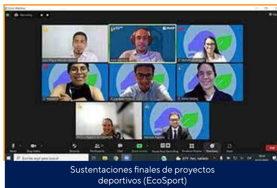
Sustentaciones finales de proyectos deportivos (EcoSport)