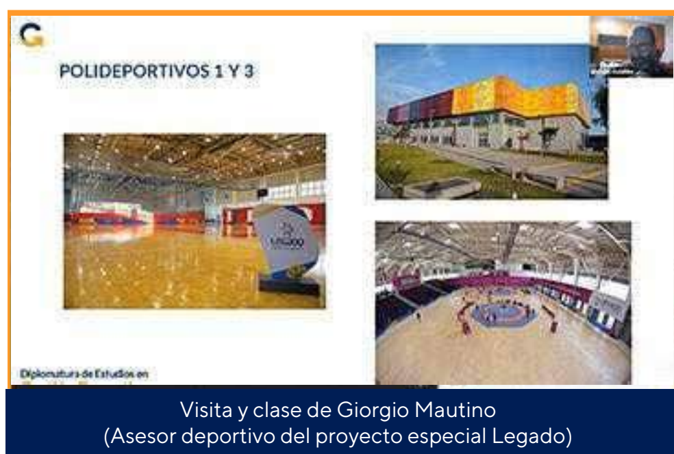
Visita y clase de Giorgio Mautino (Asesor deportivo del proyecto especial Legado)

En 2023 nuestros alumnos vivieron la experiencia de nuestra propuesta académica en gestión deportiva: Clases en vivo con los líderes del sector, invitados especiales, pasantías y proyectos en organizaciones deportivas y presentación de proyectos con asesoría de los docentes.