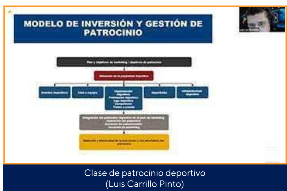
Clase de patrocinio deportivo (Luis Carrillo Pinto)