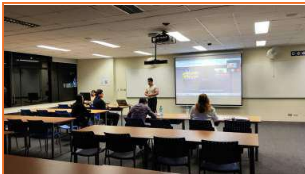
Exposiciones finales presenciales