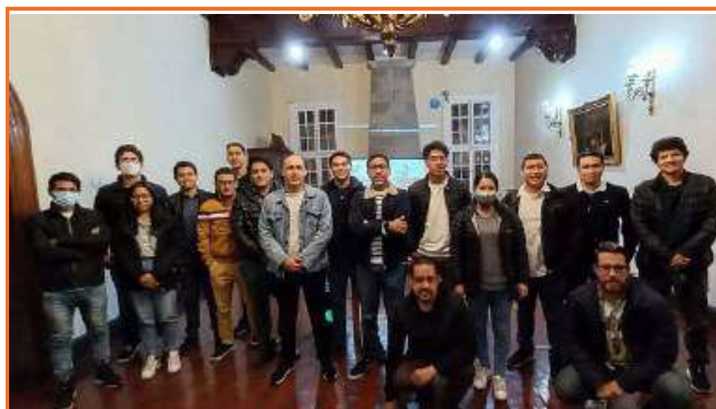
Visita al Club Lawn Tennis