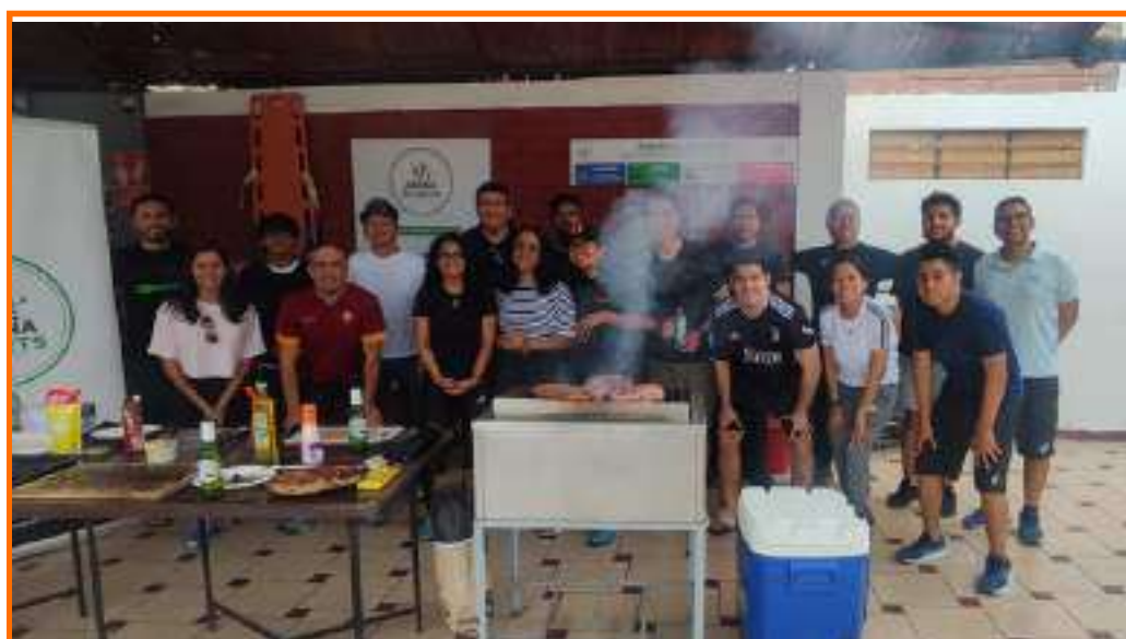
Jornada de Integración Deportiva 2024

+15 organizaciones deportivas en colaboración