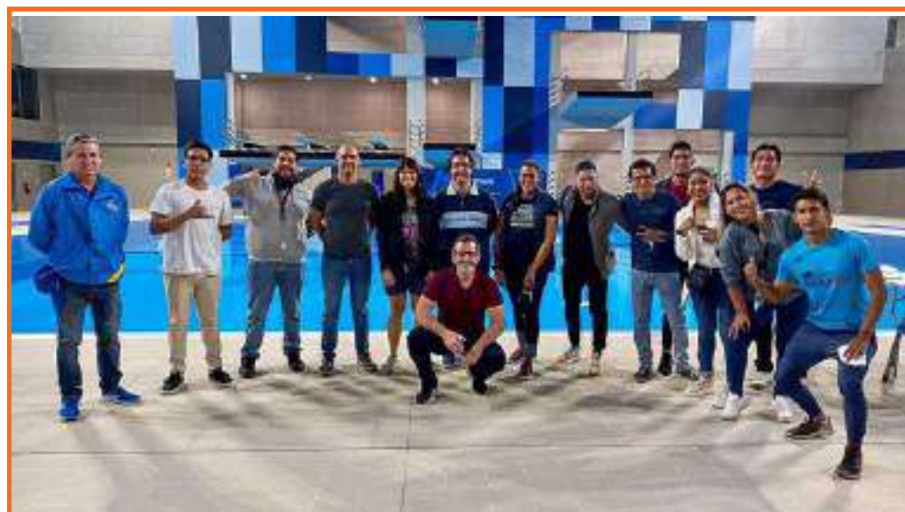
Tour GDPUCP en la VIDENA