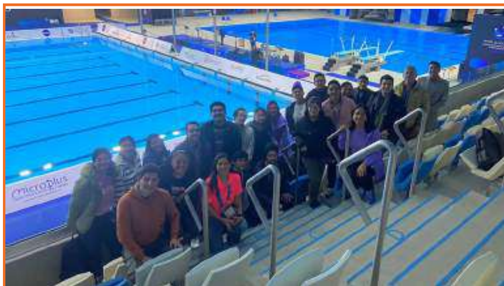
Visita de estudios al Mundial Junior de Natación Artística