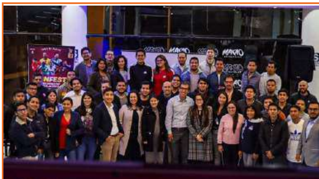
Reencuentro de exalumnos GDPUCP 2022