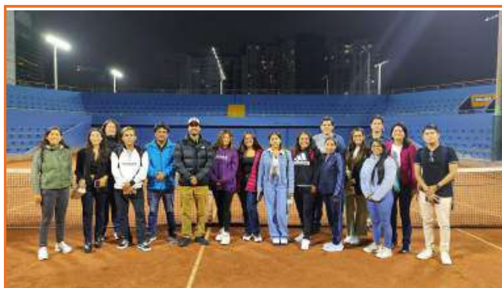
Visita de estudios al Club Lawn Tennis