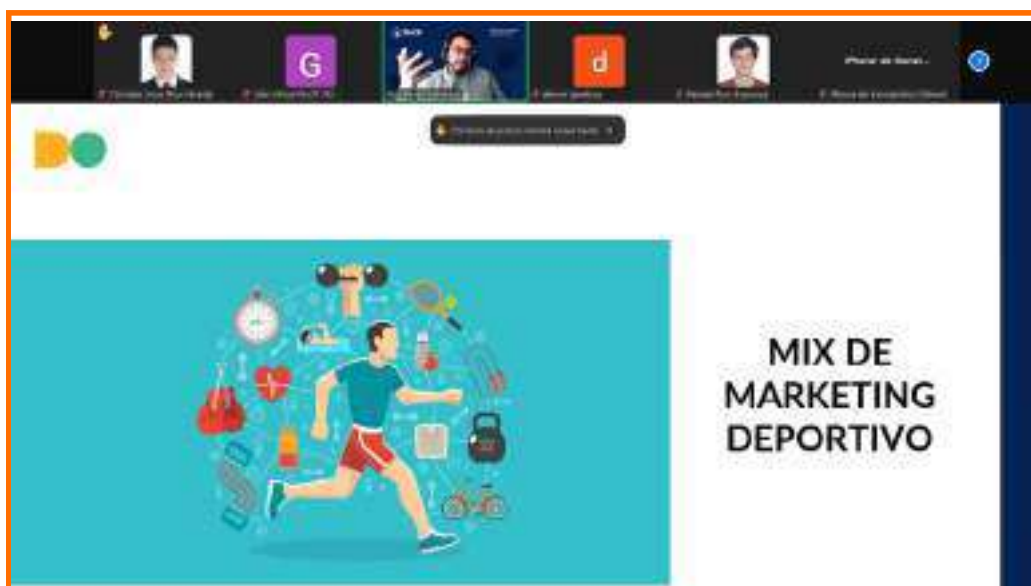
Clase de Marketing Deportivo con Humberto Meneses

En 2024 nuestros alumnos vivieron la experiencia de nuestra propuesta académica en gestión deportiva: Clases en vivo con los líderes del sector, invitados especiales, pasantías y proyectos en organizaciones deportivas y presentación de proyectos con asesoría de los docentes.