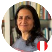
Tendencias en la comunicación