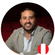
Patrocinio y estrategias de financiamiento

Ha sido Coordinador General del Proyecto de Mejoramiento de Centros Históricos Rímac y Huamanga (MINCUL-BID-AECID), asesor de la Presidencia Ejecutiva de Promperú, y asesor del Gabinete de Asesores del Despacho Ministerial en Mincetur. Ha ocupado los cargos de viceministro de Turismo del Mincetur, Gerente General de Promperú y Viceministro de Patrimonio Cultural e Industrias Culturales del Ministerio de Cultura. Asimismo, desarrolla la práctica docente en diversas instituciones de educación superior (UNMSM, UPC, USIL, PUCP, Universidad Antonio Ruiz de Montoya, Universidad Nacional de Trujillo, Escuela Nacional de Bellas Artes, entre otras) y contextos de educación no formal (Museo de Arte de Lima), en materia de cultura y turismo.