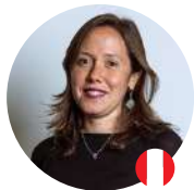
Finanzas para Proyectos Culturales Sostenibles