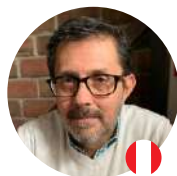
Estrategia y modelo de gestión del emprendimiento cultural