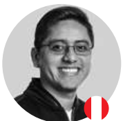
Finanzas para Proyectos Culturales Sostenibles (Contabilidad)

Actualmente, es gestora de proyectos de investigación para The Turing Way del Alan Turing Institute, el instituto nacional británico de ciencia de datos e inteligencia artificial.