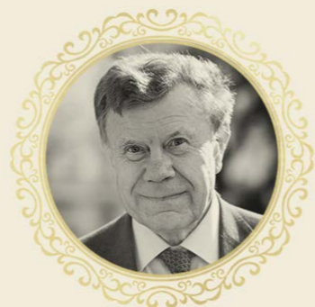
Dr. Roger Chartier

École des Hautes Études en Sciences Sociales, Collège de France